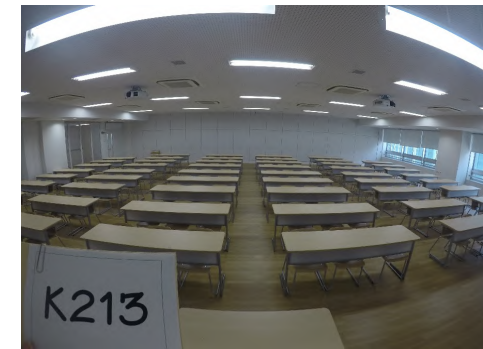
< 教卓から >