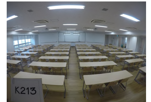
< 教卓に向かって >